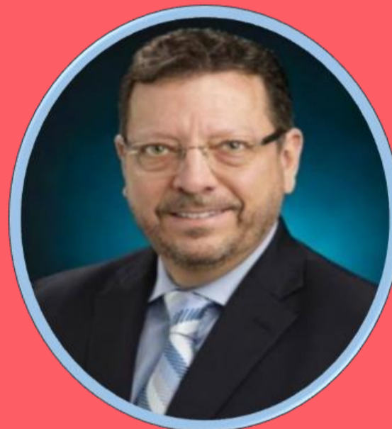
RICARDO LORET DE MOLA